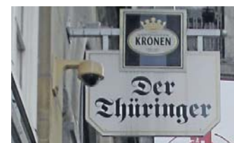
Fünf Sterne für die Wurst: Der Thüringer. Foto von Braunschweig