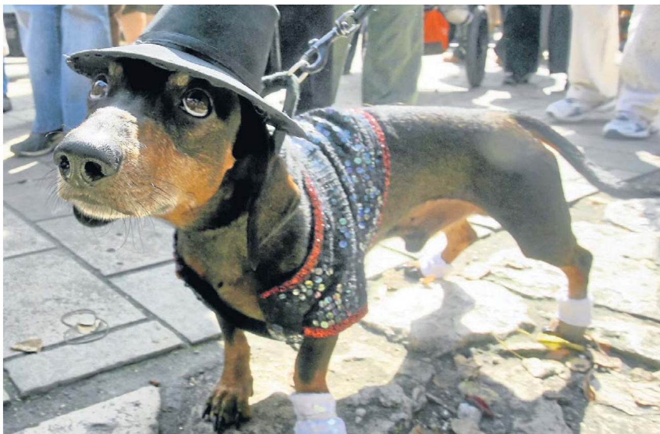
Der Hundebesitzer delegiert die anstrengende Flirtarbeit bei der Partnersuche einfach an seinen vierbeinigen Begleiter.