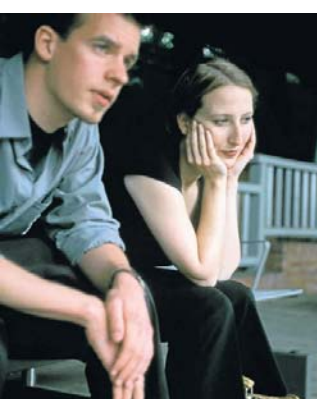
Weber-Beckmann geben am 7. November in Gelsenkirchen ihr Abschiedskonzert.